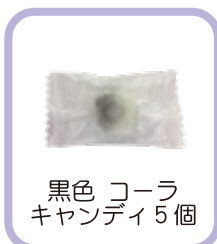
黒色 コーラ キャンディ5個