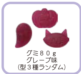
グミ 80g グレープ味 (型3種ランダム)