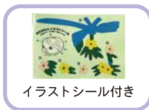
イラストシール付き