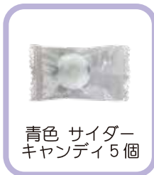
青色 サイダー キャンディ5個