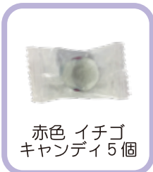
赤色 イチゴ キャンディ5個