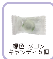
緑色 メロン キャンディ5個