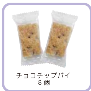
チョコチップパイ 8個